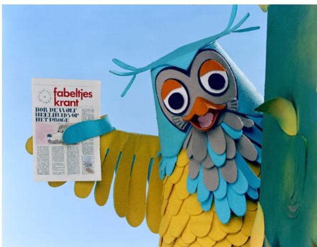
Deze afbeelding is afkomstig van de Beeld en Geluid Wik

-wij evenveel plezier hadden als de kleuters.