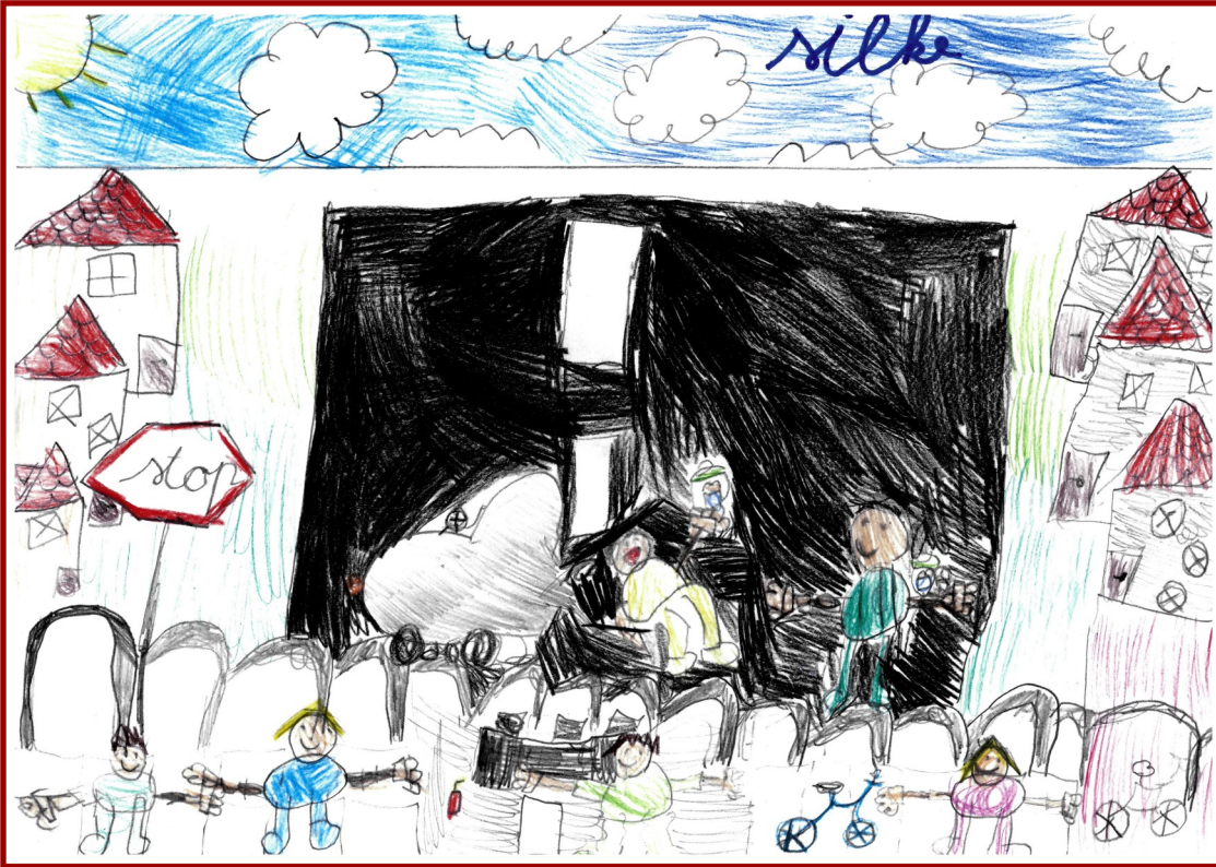
Picknicken met opa en oma op de grens.