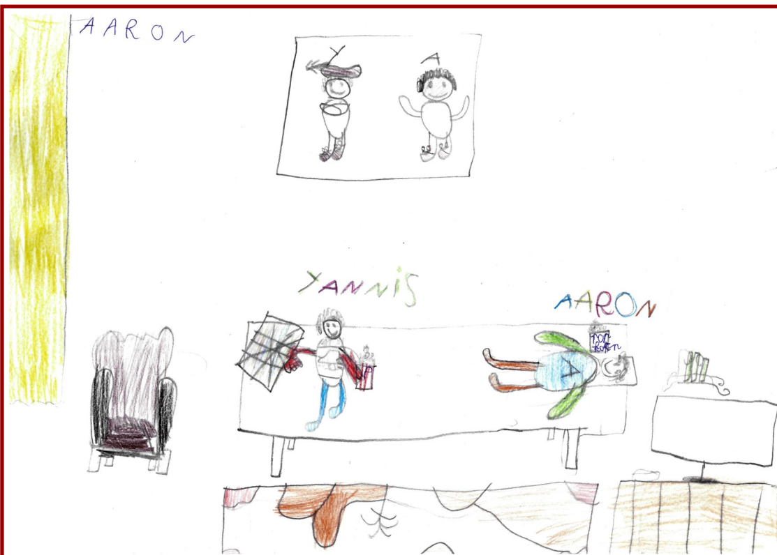
Thuis naar een film kijken met popcorn... gezellig.